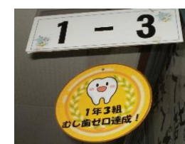
【むし歯ゼロのクラス表示】 【1の3・2の1・7組達成】

本校では、健康の保持増進を図り、自ら健康について考え行動することができる生徒の育成を目指し、むし歯ゼロに向けて早期受診を勧めています。 現在の荒川中学校のむし歯の治療状況は、むし歯保有者65人(全校348人中)のところ、治療済46人、治療中6人です。 生徒保健委員会では、生徒用玄関にむし歯受診状況や歯科に関する資料を掲示してむし歯の治療を呼びかけています。また、むし歯ゼロのクラスを表彰し、教室のクラス表示の下に「むし歯ゼロのメダル」を表示しています。3クラスが、むし歯ゼロを達成しています。 今年度もあと3ヶ月となりました。3月までに全校で「むし歯ゼロの達成」にご協力をお願いします。